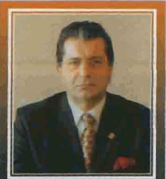
BURHAN KÜLÜNK (Yönetim Kurulu Başkan Vekili)

Aralık 2003 tarihinde Bayındırlık ve İskan Bakanlığı Müsteşar Yardımcılığına atanan YAMAÇ İngilizce, Almanca, Arapça bilmekte olup, evli ve 4 çocuk babasıdır.